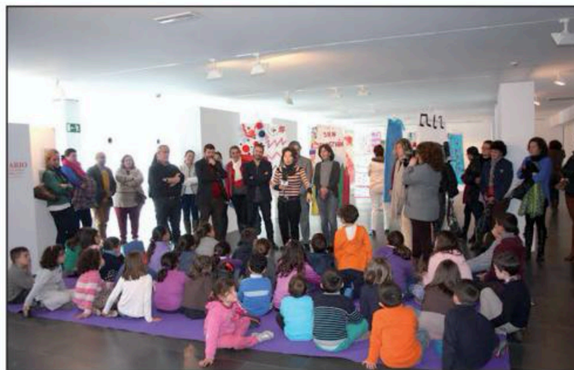
Los niños atendiendo a las explicaciones de los monitores.

La exposición "La vida breve. Dibujos para una ópera" se creó a partir del diseño de vestuario y creaciones audiovisuales de la ópera "La vida breve" de Manuel de Falla en el centenario de su estreno. Esta muestra ha sido realizada por los estudiantes de los másteres oficiales de la Universidad de Granada: "Dibujo: creación,